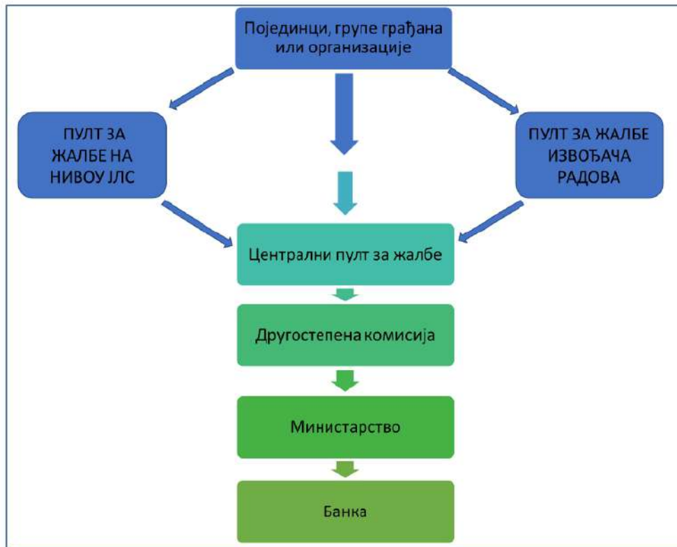
Слика 1. Шема функционисања жалбеног механизма

доноси Другостепена комисија образована решењем министра грађевинарства, саобраћаја и инфраструктуре. Организација ЖМ-а је представљена на слици 1 овог документа.